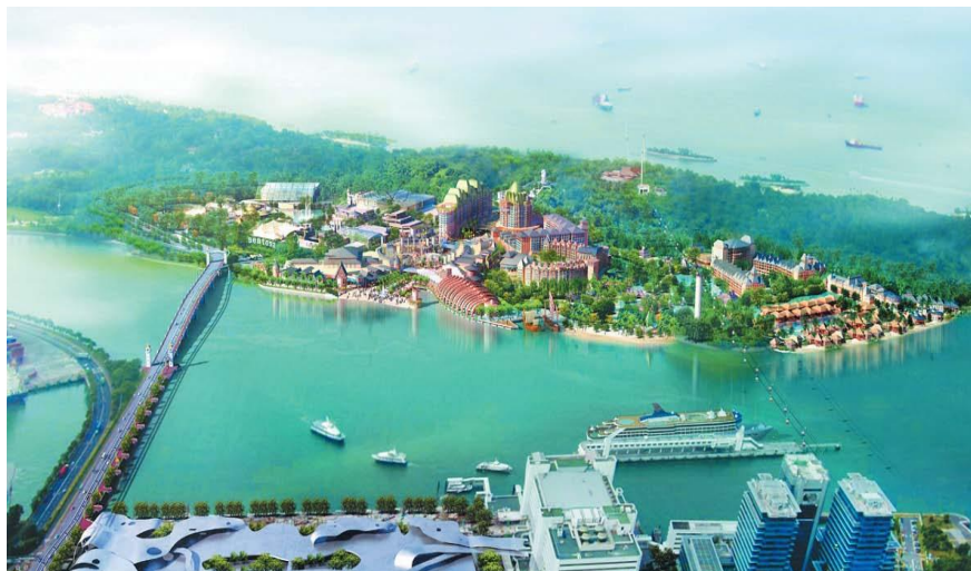
北京京冶工程有限公司承建的圣淘沙综合娱乐设施项目（部分）

新加坡对华投资主要项目包括：中新三个政府间合作项目苏州工业园区、天津生态城、中新（重庆）战略性互联互通示范项目，以及广州知识城、吉林食品区、新川科技创新园、南京生态科技岛等。