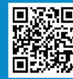
联合国贸法会观察员专家团