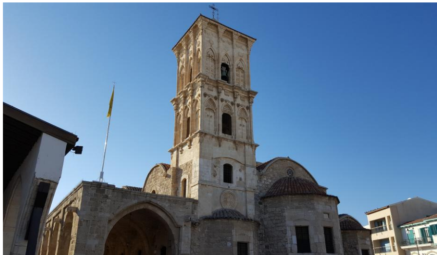
拉纳卡圣拉撒路教堂

当地许多风俗大都与宗教有关，复活节为最盛大的宗教节日，受到重视的程度甚至超过圣诞节。在参观教堂等宗教场所时，应避免穿着短裤和无袖衣服。