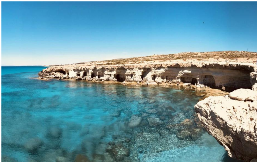
阿依纳帕（圣纳帕）海洞

【旅游业】旅游业作为塞浦路斯第三产业的龙头，在国民经济中发挥着支柱作用。塞浦路斯旅游资源丰富，既有蓝天、碧海、沙滩，也有城堡、教堂、葡萄园。塞浦路斯坐拥850公里海岸线、65个蓝旗海滩，99.1%的海水浴场水质“极好”，比例为欧盟最高。“阳光、沙滩、海水”成为塞浦路斯吸引游客的三大法宝。塞浦路斯是典型的地中海气候，夏季长达半年，干燥炎热，适宜水上运动，是旅游旺季。冬季短暂，温润多雨，山顶有滑雪场，可以一天之内上山滑雪、下海游泳。根据欧盟统计局数据，疫情前，塞浦路斯旅游业对GDP贡献率在15%左右，提供了约5万个就业岗位，占非金融类就业岗位的20%。2020年，受新冠肺炎疫情冲击，塞浦路斯旅游业损失惨重。全年访塞游客仅64万人次，同比下降84.1%，旅游业收入3.92亿欧元，同比下降85.4%。