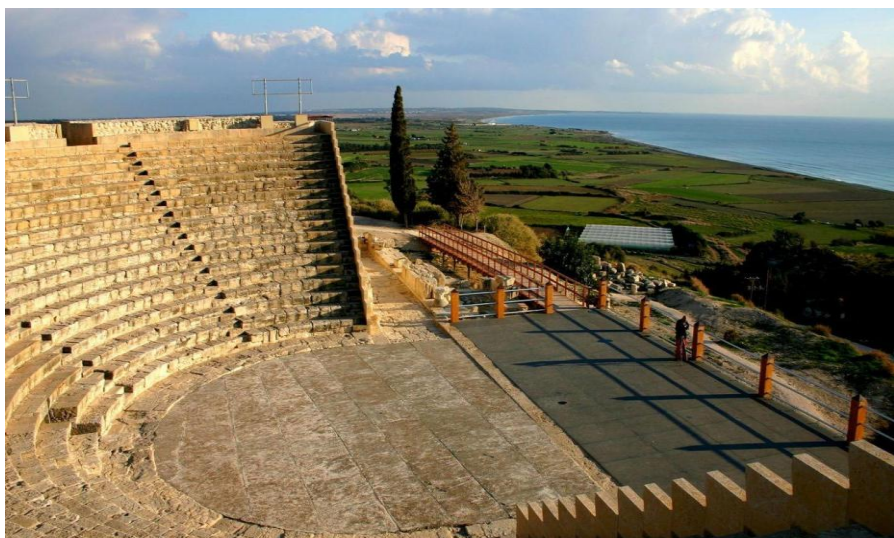
库伦剧场考古遗址

塞浦路斯主要有希腊族（简称“希族”）和土耳其族（简称“土族”）两大民族。塞浦路斯分裂前希土两族混居，从1974年7月开始，希腊族主要居住在塞浦路斯南部，土耳其族主要居住在塞浦路斯北部。此外，在土族控制的北部地区还有来自土耳其的移民居住，塞浦路斯政府一直未承认这部分移民的合法身份。