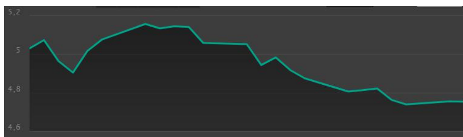
本月美元/雷亚尔汇率走势

本月雷亚尔的表现现在主要新兴市场货币中排名第三，仅次于俄罗斯卢布和哥伦比亚比索。